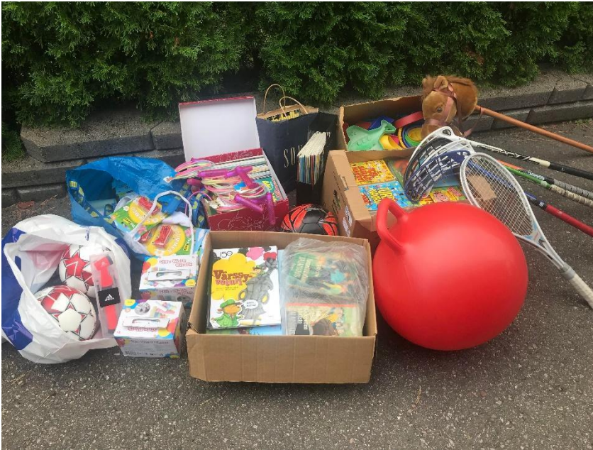
Lahjoitimme koululle hiihtovälineitä, jalkapalloja, kirjoja, mailoja ja muita tarvikkeita. Osan tarvikkeista saimme lahjoituksina ja osan hankimme Ykkyn varoista.