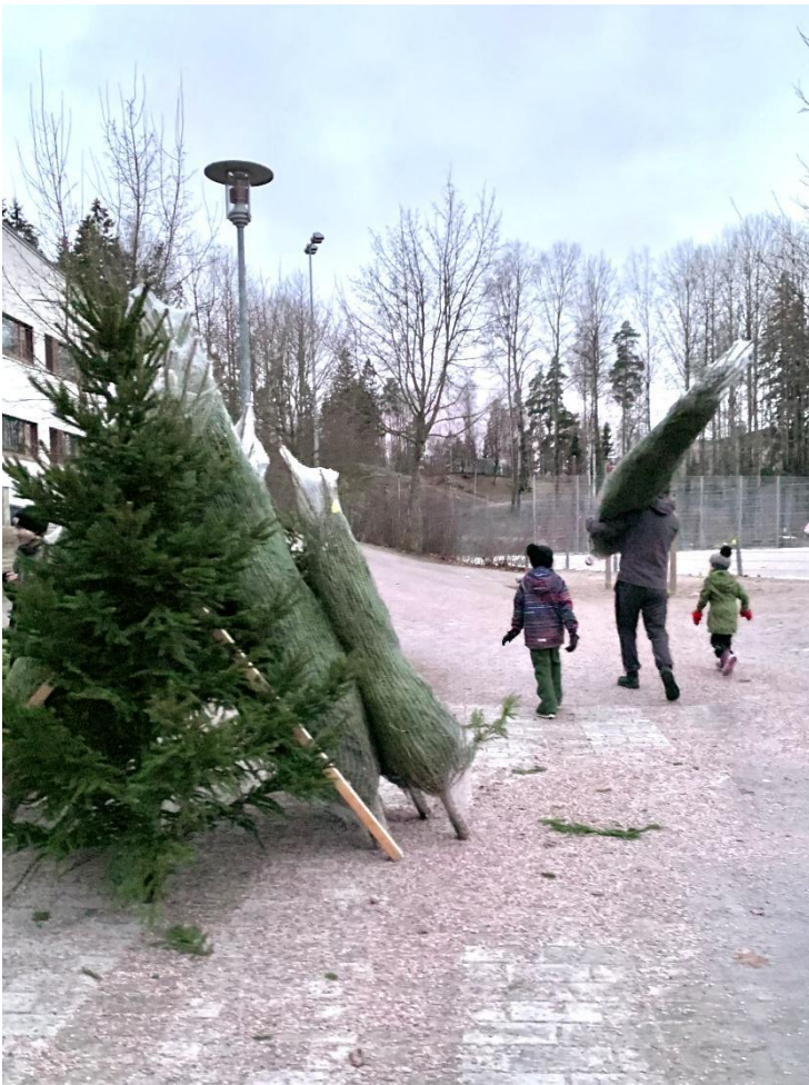
Hankimme Ykkylle varoja myymällä joulukuusia Ymmerstan koulun pihalla. Reippaat Ykky-aktiivit sahasivat kuuset sopivaan mittaan ja pussittivat ne kotiinkuljetusta varten.